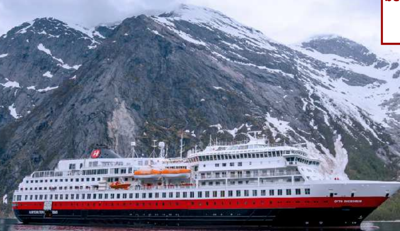
MS Otto Sverdrup in beeindruckender Fjordkulisse