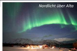
Nordlicht über Alta