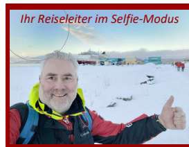
Ihr Reiseleiter im Selfie-Modus