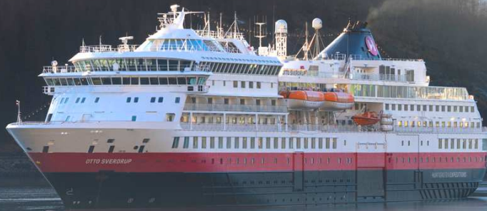
MS Otto Sverdrup im Romsdalsfjord