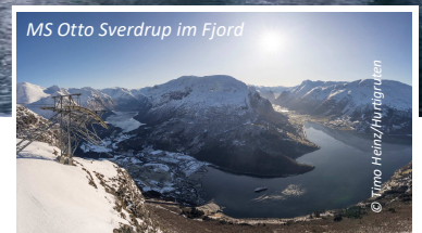
MS Otto Sverdrup im Fjord