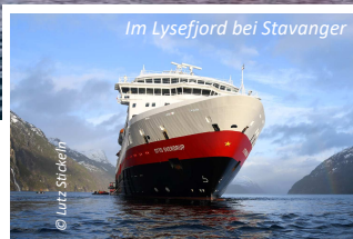
Im Lysefjord bei Stavanger