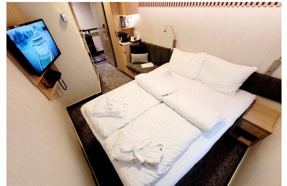
Doppelbett-Kabine J2 (oben) und U2 (unten)