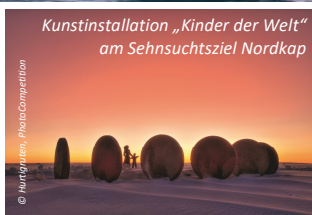
Kunstinstallation „Kinder der Welt“ am Sehnsuchtsziel Nordkap