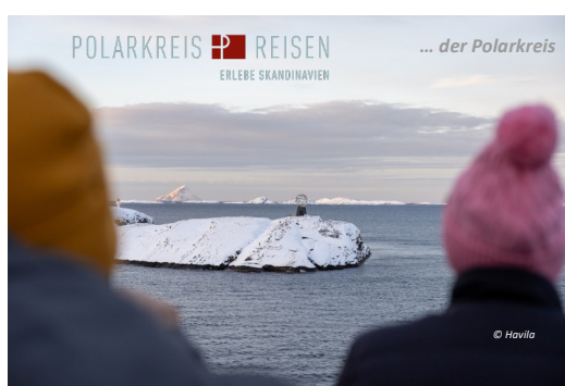
POLARKREIS REISEN ... der Polarkreis ERLEBE SKANDINAVIEN

Sonderpreis! So NUR BEI UNS buchbar + 2.000 NoK Bordguthaben pro Person bei Buchung bis 17. Juli 2026