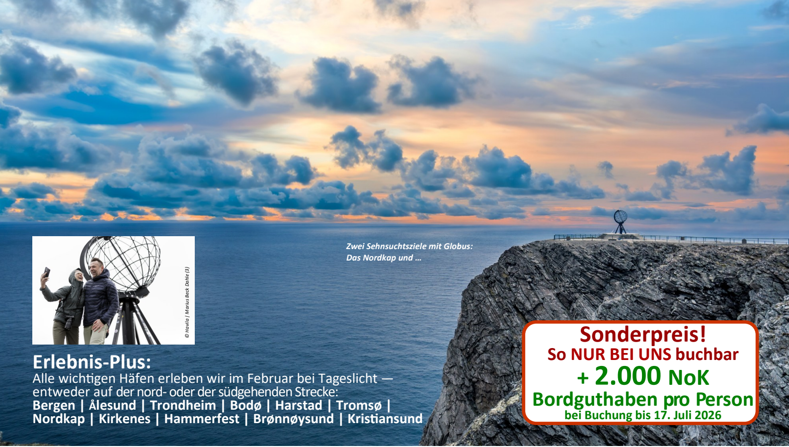
Zwei Sehnsuchtsziele mit Globus: Das Nordkap und ...