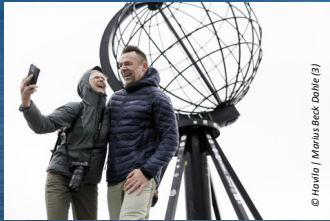
© Havila | Marius Beck Dahle (8)